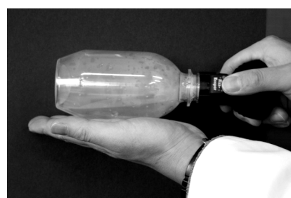
図2 雲の発生 左：圧縮中、右：ふたをはずすと雲が発生