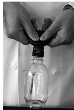
図1 断熱膨張・断熱圧縮

雲発生実験器には、液晶温度計（目盛り間隔 2^{\circ}\text{C} ）が付属している。ペットボトルに空気を目一杯送り込むと、温度が約 2^{\circ}\text{C} 上昇することが分かる。また、ポンプのふたをはずすと、低下して元の温度に戻る。ボイル・シャルルの法則である。