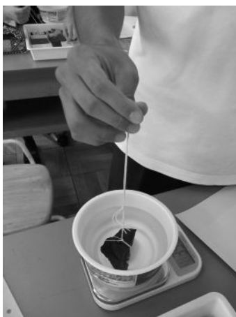
図1 岩石を水中でつるす