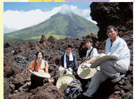
2008年フィリピン大会 銀メダル3個 銅メダル1個

なお、本選は合宿研修を兼ねた「グランプリ地球にわくわく」として、茨城県つくば市で行われます。