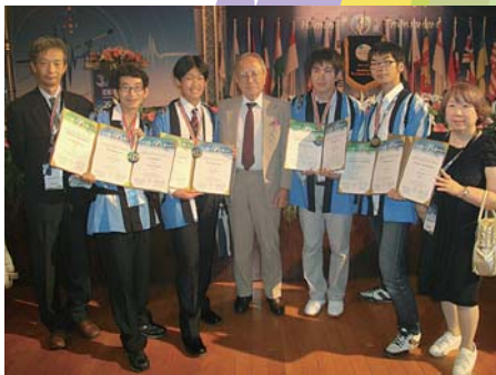
2009年台湾大会 銀メダル4個