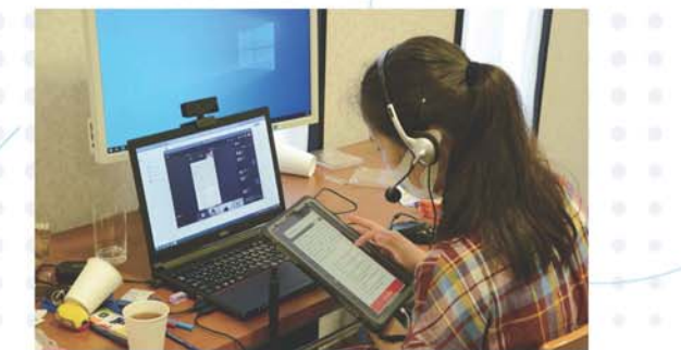
慎重な判断が必要!?