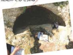
日陰で気持ち良い!