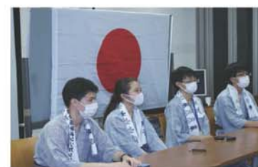
やや緊張する選手たち