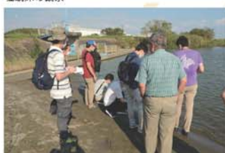
霞ヶ浦湖畔で砂を採取!