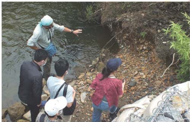
川岸に降りて観察!