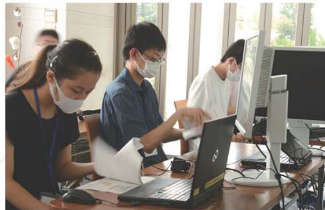
PCの準備を行う選手たち

8月24日、日本選手団はつくばに集合し、事前準備やパソコン環境などの確認を行った。NTFIの発表準備なども入念に行われ、メンターからの鋭いアドバイスを受けて発表の質に磨きがかかった。