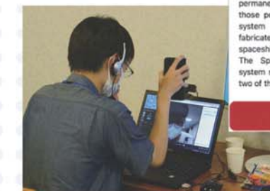
海外選手と相談しながら火星探査!