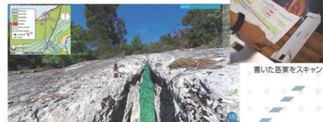
書いた答案をスキャン

大会2日目にはデータマイニング試験(Data mining test; DMT)が行われた。ウェブ上の情報を利用して自ら探したデータを基に考察する、というオンラインならではの試験形態となっていた。衛星画像や地震波データをはじめ、YouTubeにアップロードされた動画等を基に考察する問題などもあった。バーチャルに巡検しているような感覚になれるアプリケーションもあり、これまでのIESOにはなかった面白い形式の試験であった。