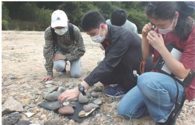
拾った岩石を分類する

国別野外調査(National Team Field Investigation; NTFI)は各国選手団が事前に国・地域内で野外調査を行い、その結果をIESO期間中に発表を行う行事である。例年であれば開催国にて様々な国や地域の選手からなるチームで調査・発表を行う国際野外調査(International Team Field Investigation)が行われるが、本年はオンライン開催のためこのような形での実施となった。日本選手団は6月の事前研修合宿において茨城県南部の桜川を調査し、桜川で見られる火山岩の由来についての考察を発表した。