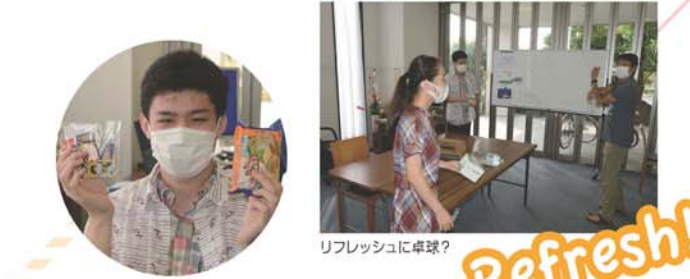
発表準備の中に嬉しい差し入れ!

地球システム調べ学習(Earth System Project; ESP)は様々な国・地域の選手からなるチームで調べ学習・発表を行うイベントである。「COVID-19と地球システムとの相互関係」「炭素固定と地球システムとの相互関係」といったテーマが与えられた。大会2日目~3日目は、選手たちはZoom等を用いて海外選手と積極的にやり取りしながら、夜遅くまでESPの発表準備を行った。