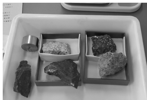
図1 岩石試料と収める小箱